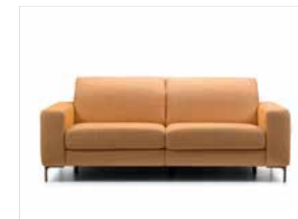
SAMOA | 300CT240 | EVITA GREY