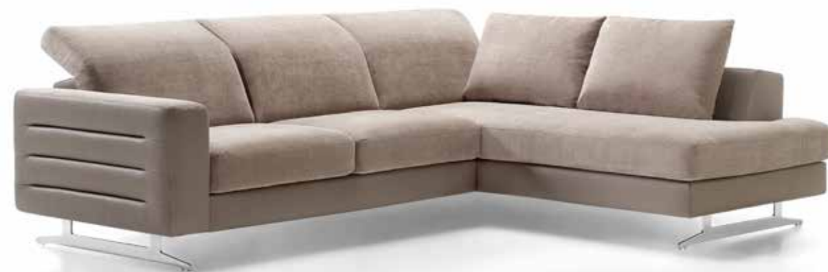
SAMOA | BS280 | MONA TAUPE - NEVADA TAUPE