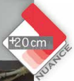
SAMOA | MONTANA LILA