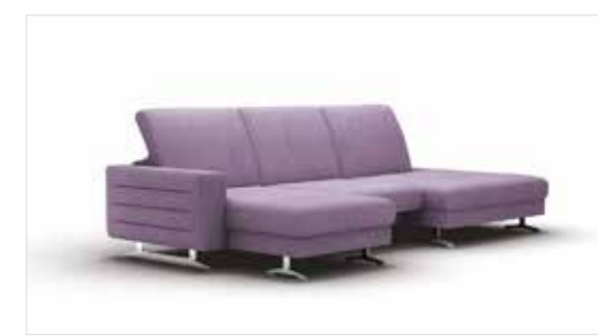
SAMOA | CF300 | EVITA LILA