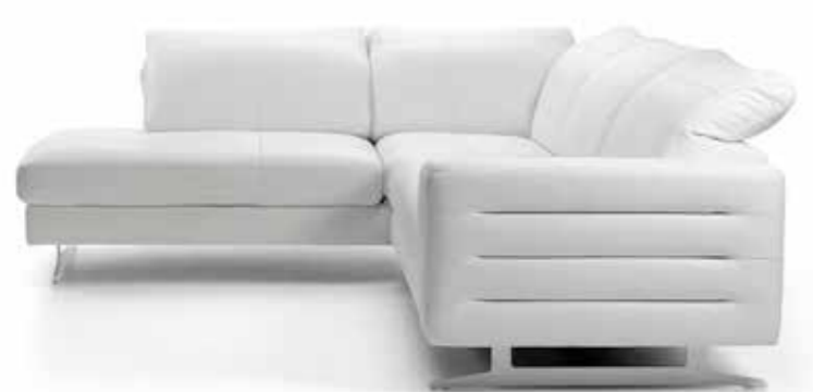
SAMOA | GB300 | TRENINO+ WHITE