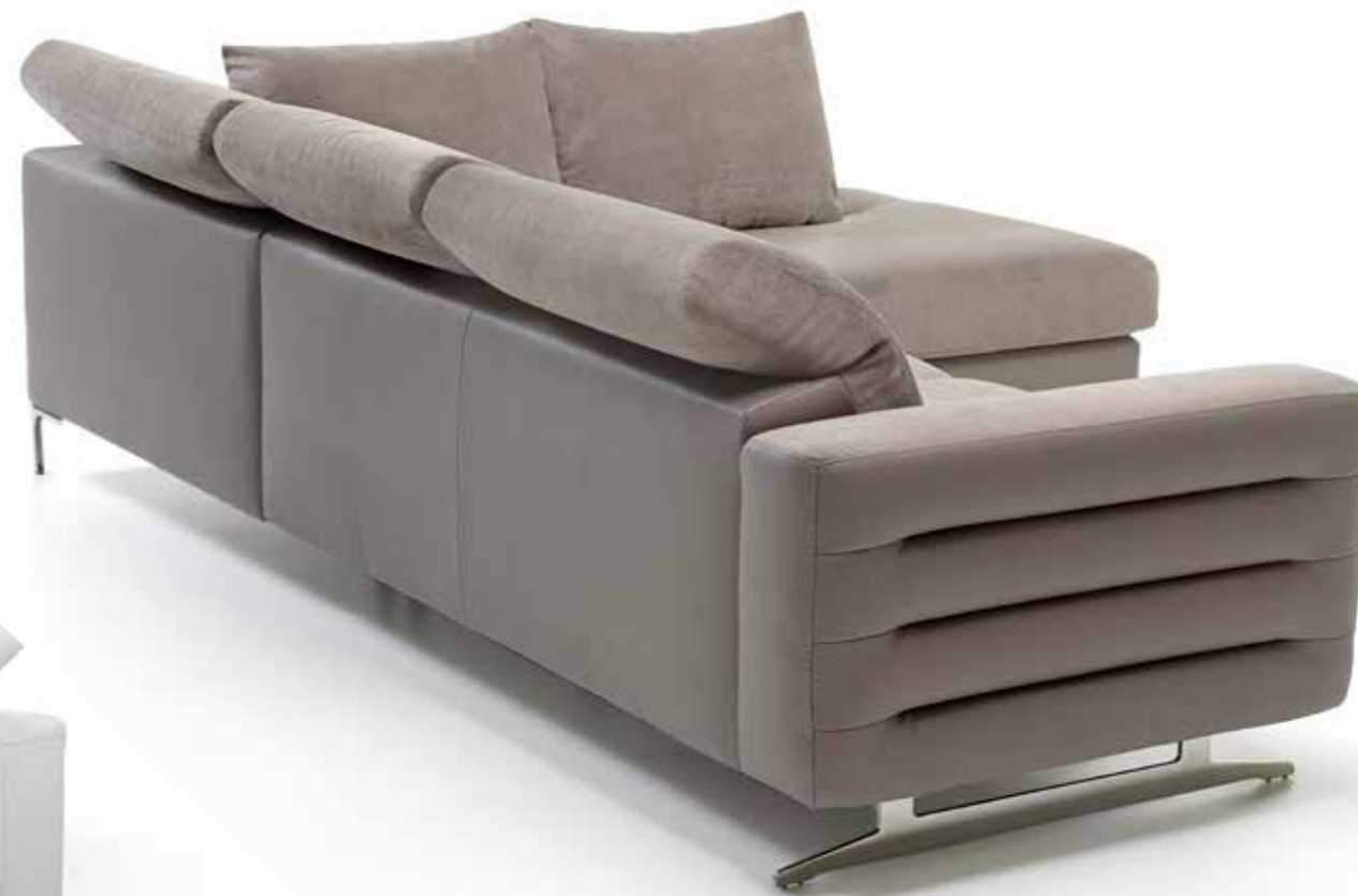
SAMOA | GB300 | TRENTINO+ WHITE

KUBISTISCH EN RECHTE LIJNEN? JA ZEKER! EN BOVENDIEN GEWELDIGE DETAILS DIE IEDEREEN VOOR ZICH ZELF KAN KIEZEN.